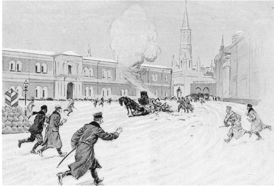
L'Illustration, No. 3235, 25 Février 1905

Рассмотрите изображение и выполните задания 15, 16.